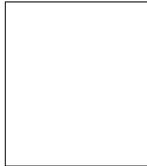
ตำแหน่ง นายช่างโยธา